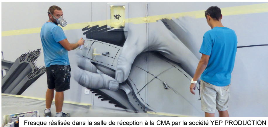
Fresque réalisée dans la salle de réception à la CMA par la société YEP PRODUCTION