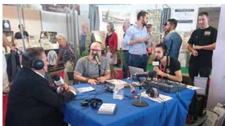
Radio Aviva, 88FM, partenaire média sur le stand de la CMA34

À l'intérieur du Pavillon Artisanat, nous proposons