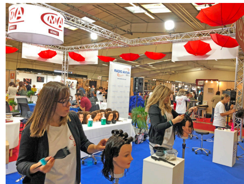
Les étudiants en coiffure du Campus des Métiers CMA34