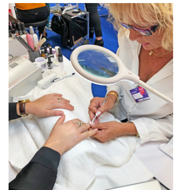
Ésthetique : la formation continue des artisans