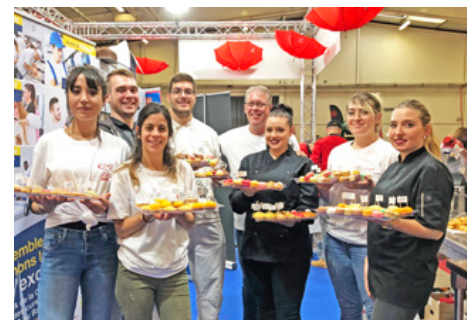
Étudiants en pâtisserie du Campus des Métiers CMA34