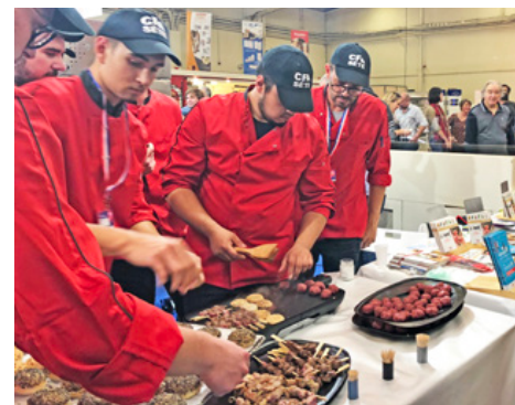
Les apprentis bouchers du CFA Nicolas Albano à Sète