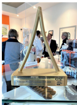
CHOCOLATERIE DU BLASON Chocolaterie et pâtisserie artisanale Clermont-L'hérault