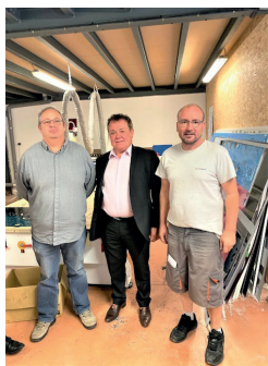
FLASH ENSEIGNES Conception et fabrication de panneaux publicitaires Clermont-L'hérault