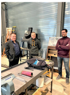
SAS METIERS DU FER Métallerie, ferronnerie, serrurerie, restauration du patrimoine Lodève