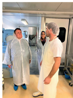
LES FROMAGES DU SALAGOU Fromagerie artisanale (chèvre, brebis, vache) Lodève