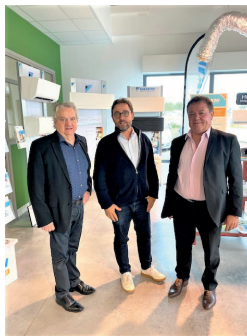
CONFORT CLIMAT Pompe à chaleur, chauffage réversible et climatisation Clermont-L'hérault