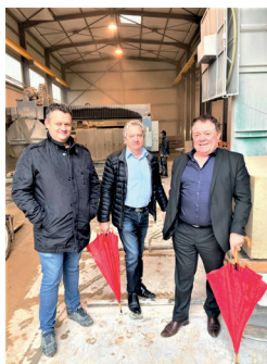
SARL MUZZARELLI Rénovation et restauration du patrimoine bâti Lodève